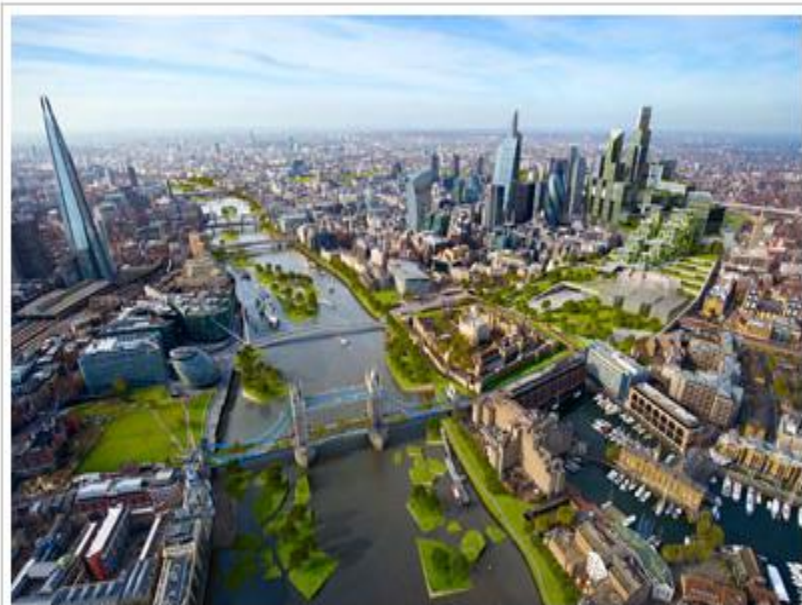
John Robertson Architects / Arup.